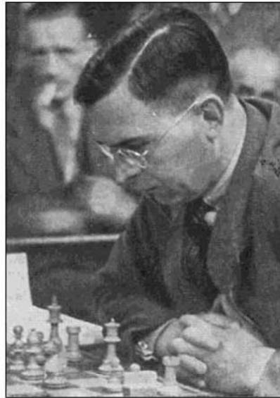
Dr. M. Euwe.

At præsentere dr. Euwe er aldeles unødvendigt, dr. Euwe er kendt og skattet ikke blot som spiller, men også som person. Han er en personlighed af så usædvanligt format, at man ligefrem forbavses. Hans position som en af verdens fornemste spillere har på ingen måde fjernet ham fra den jævne men-